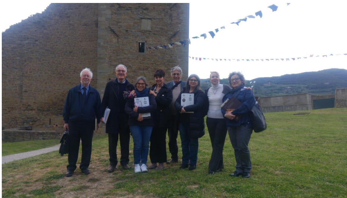
Il gruppo dei convegnisti nel prato del cassero di Castiglion Fiorentino.

Il 18 maggio 2019 si è svolta nella sala Sant'Angelo del cassero di Castiglion Fiorentino la prima giornata di studio interamente dedicata alla medagliistica napoleonica avente come tema Napoleone e la sua famiglia: un'Europa da rivedere . Vi hanno partecipato i direttori dei più importanti musei italiani, docenti universitari ed illustri studiosi della materia. Dopo