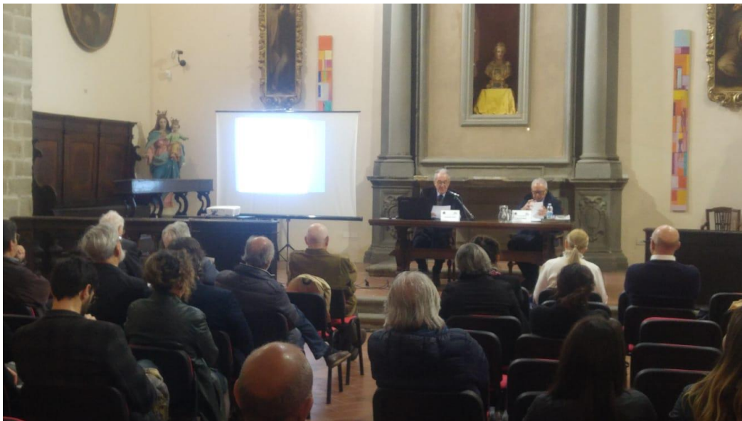
L'apertura del convegno.

Le relazioni, tutte di alto valore scientifico, hanno evidenziato alcuni spunti che potranno essere oggetto di approfondimento per studi futuri e fatto il punto sulla quantità delle medaglie napoleoniche presenti nei medaglieri dei musei italiani illustrati dai rispettivi direttori.